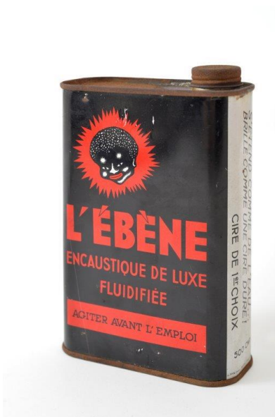
Cire et cirage L'Ébène®