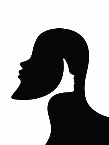
Visuel de l'affiche Nous et les autres