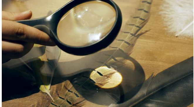
Zoom sur les plumes

Les maîtres-mots de leurs expositions sont le sens, l'interaction, l'immersion, la variété, l'originalité. Activer les leviers de l'émotion, du plaisir, de l'émerveillement constitue une base essentielle à l'apprentissage.