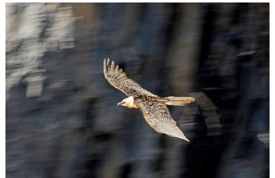
Gypaète filé